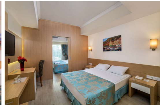
Головний корпус - сімейний номер