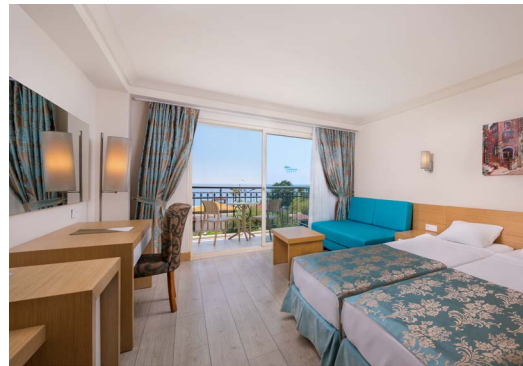
Головний корпус - стандартний номер