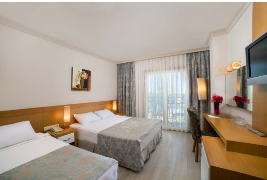
Корпус Аннекс - стандартний номер